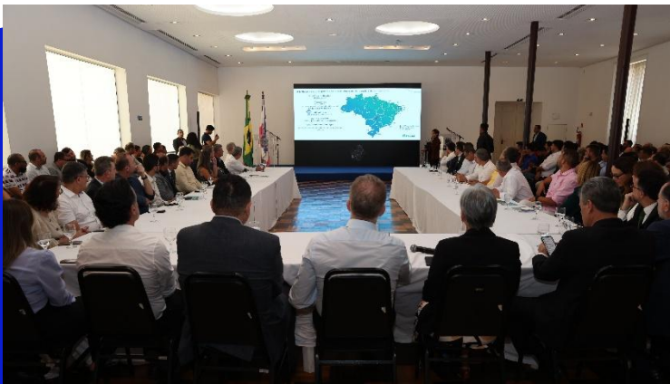
Figura 5 – Reunião com os Prefeitos sobre o Projeto

parcerias público-privadas (PPPs) que possam viabilizar a ampliação dos serviços de abastecimento de água e esgotamento sanitário em 32 municípios capixabas, em consonância com as metas do Marco Legal do Saneamento, que estabelece o atendimento de 99% da população com água tratada e 90% com coleta e tratamento de esgoto até 2033. O Universaliza.ES é coordenado pela Secretaria de Saneamento, Habitação e Desenvolvimento Urbano (Sedurb) e pela