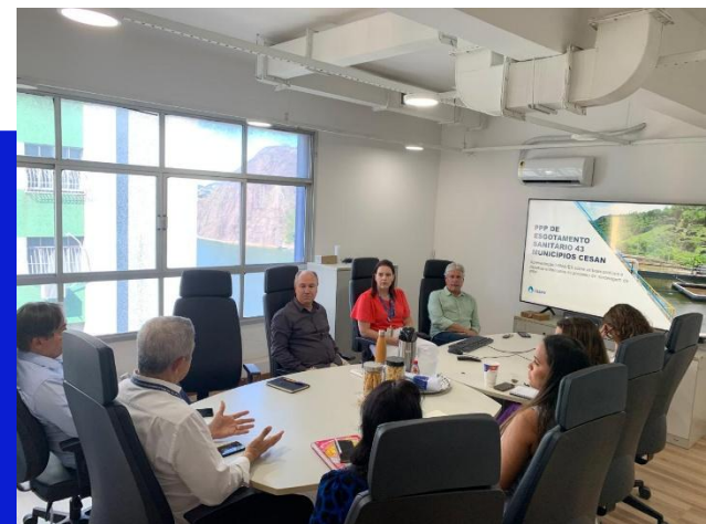
Figura 7 – Reunião de Repasse PPP da CESAN