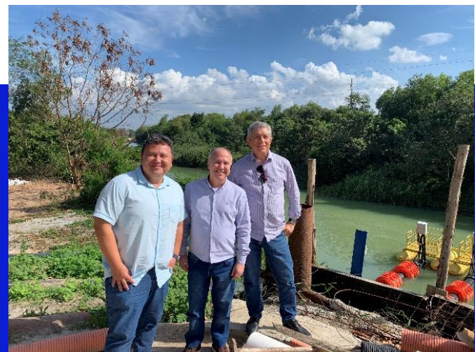
Figuras 11 e 12 – Visitas aos SAAEs de Jaguaré e Linhares – ES