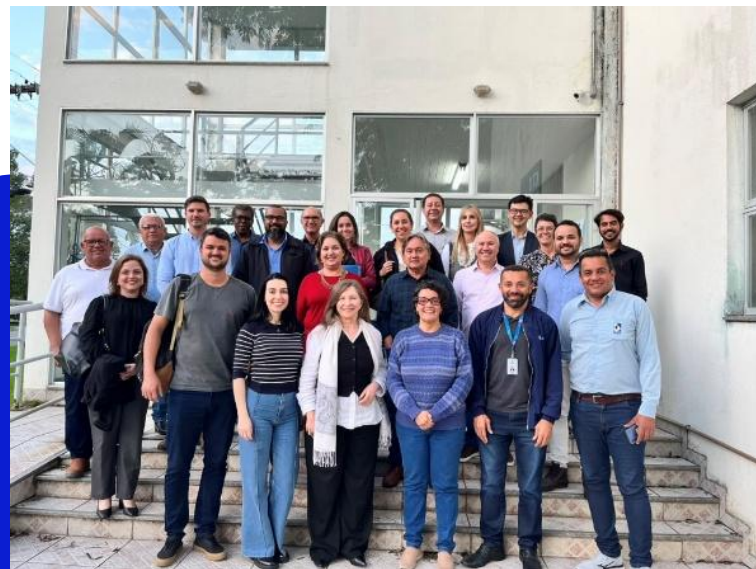
Figura 8 – Reunião na UFES – Projeto de Segurança Hídrica

A MRAE/ES participou ativamente dos eventos de construção do Projeto Segurança Hídrica e Desenvolvimento Regional Sustentável, que é uma iniciativa da Agência Estadual de Recursos Hídricos (Agerh), do Instituto Jones dos Santos Neves (IJSN), do Laboratório de Gestão de Recursos Hídricos e Desenvolvimento Regional da Ufes (LabGest) e do Núcleo Estratégico em Água e Desenvolvimento (Neades) – que faz parte do Centro de Pesquisa, Inovação e Desenvolvimento (CPID), vinculado à Secretaria da Ciência, Tecnologia, Inovação e Educação Profissional (Secti).