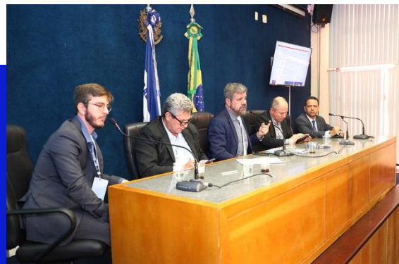
Figura 13 – Diálogos Federativos na ALES

evento nacional sediado na ALES, com participação da MRAE/ES. O evento teve como foco o fortalecimento da cooperação entre os três níveis de governo, com o objetivo de enfrentar desafios comuns e elaborar propostas