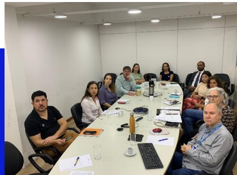
Figuras 1 e 2 – Reuniões do Comitec da MRAE